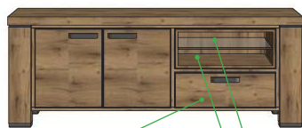
19,2x55x45 Art.39588 60x160x45 21,8x55x45 19,2x55x45