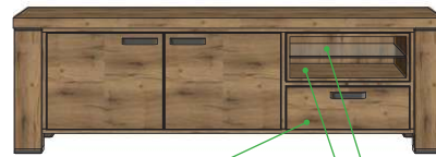
19,2x55x45 Art.39589 60x190x45 21,8x55x45 19,2x55x45