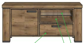
19,2x55x45 Art.39587 60x130x45 21,8x55x45 19,2x55x45