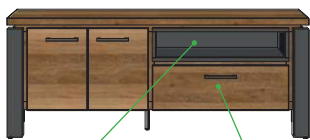
16x68x39 Art.38747 22x68x39 60x150x45